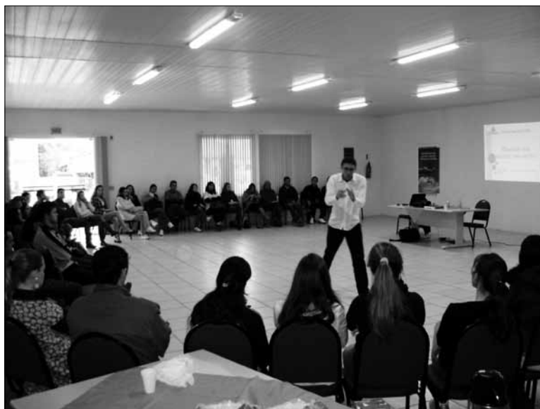
Curso de formação para colaboradores, 03 de julho de 2010 – Dona Emma / SC.

A cada atividade formativa realizada pela cooperativa, em parceria com a Base Vale do Itajaí e Cresol Central SC/RS, avançava-se no intuito de consolidar a marca Cresol e, acima de tudo, na construção de um cooperativismo que atenda as demandas e necessidades dos agricultores. Atribui-se, em grande medida, o sucesso da Cresol Dona Emma nestes 10 anos de muitas conquistas ao conjunto de atividades formativas que foram realizadas, pois acreditamos que ela, por ser um dos sete princípios do cooperativismo, contribuiu substancialmente para o fortalecimento do associativismo.