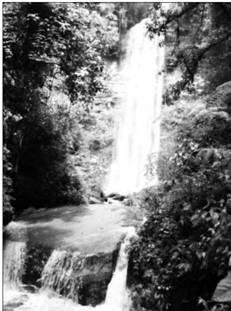
Cachoeira do Rio Dona Emma, no bairro de Nova Esperança. Imagem retirada do site da Prefeitura Municipal de Dona Emma – fevereiro de 2011.