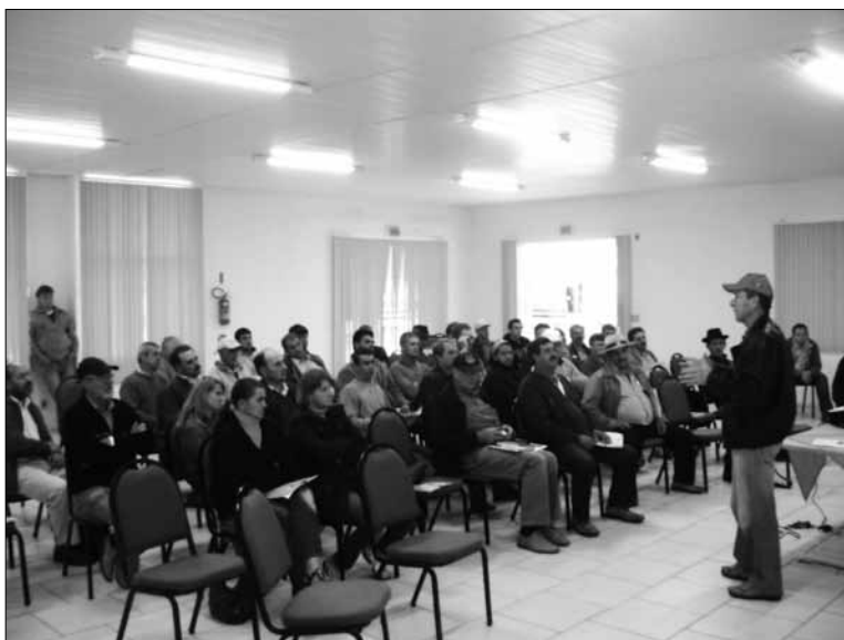
Reunião com os agentes de Crédito.

Mensalmente são reunidos os agentes da cooperativa, sempre com o intuito de repassar as informações sobre a Cresol, seus produtos e serviços, seus indicadores, sobre os cenários para a agricultura, entre outros temas afins ao Sistema. Inegavelmente, o trabalho das lideranças tem contribuído de forma substancial na consolidação da Cresol Dona Emma nestes seus 10 anos de história.