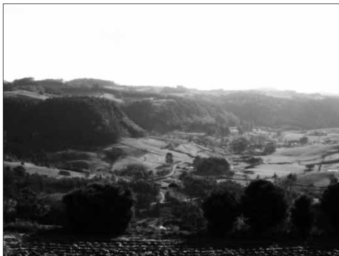
Os diversos vales que compõem o município de Dona Emma.

O clima predominante é o mesotérmico úmido com verão quente (Cfa), segundo a classificação de KOEPPEN, sem estação seca e com verões quentes. A temperatura média é de 18,3°C e a precipitação pluviométrica varia de 70 a 110 milímetros, nos meses de abril a agosto, e de 130 a 170 milímetros, entre os meses de setembro a março. O município possui em torno de 200 km de estradas, interligando as várias localidades à sede e aos municípios vizinhos.