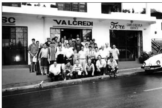
Viagem para o Paraná.

Em 1999 várias lideranças e agricultores iniciam os debates visando a constituição de uma cooperativa de crédito solidária que atendesse as demandas dos agricultores familiares. É neste cenário que, no ano de 2000, um grupo de lideranças com conhecimento da existência do Sistema Cooperativo na região sudoeste do Paraná e Oeste Catarinense visitou algumas cooperativas, com o intuito de melhor conhecer e entender a dinâmica (missão e princípios) e o funcionamento de uma Cresol.