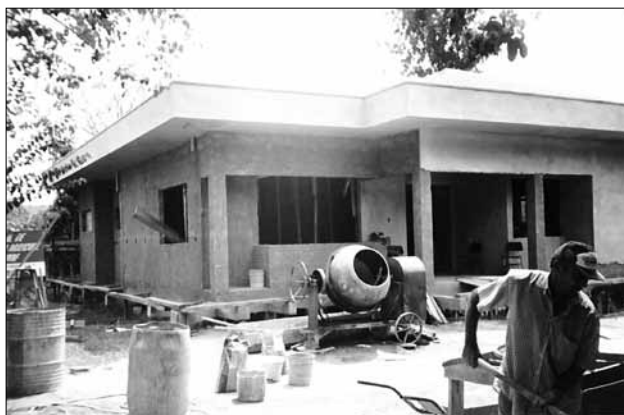
Construção da sede da Cresol Dona Emma

Outro marco importante no itinerário histórico da Cresol Dona Emma é referente à construção da sede própria, ocorrida entre os anos de 2003 e 2004. Trata-se de um importante passo para esta Singular, pois trouxe como consequência o aumento da credibilidade da cooperativa por parte da comunidade.