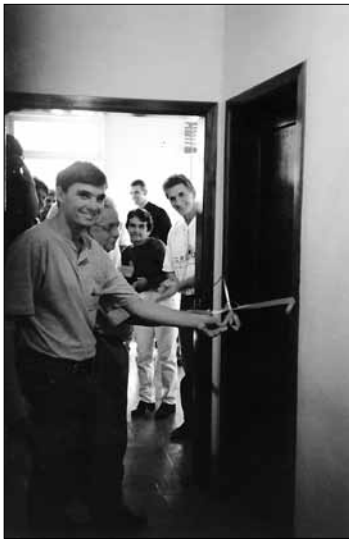
Abertura da Cresol.