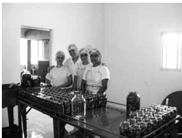
Pronaf investimento para agroindústria familiar financiado pela Cresol Dona Emma.

Com os recursos oriundos do Pronaf acessados via Sistema Cresol, muitos agricultores familiares mudaram sua realidade agrícola, pois conseguiram ampliar e qualificar sua produção, gerando maior renda e qualidade de vida. São centenas de agroindústrias financiadas pelo Pronaf Investimento, milhares de agricultores que aumentaram sua produção leiteira graças a Cresol.