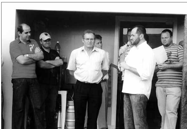
Inauguração da Rádio Comunitária.

[...] fortalecimento da agricultura familiar, o Pronaf Investimento, as Unidades de Atendimento Cooperativo em outros municípios, a festa do agricultor e do motorista, uma linha especial para habitação, sendo que a direção e a gestão são dos próprios agricultores.[...] Os diferenciais da Cresol têm sido a proximidade entre a cooperativa e seus associados, as campanhas de capitalização e captação, o crédito direcionado e assistido para o agricultor familiar, as taxas de juros mais baixos, visando sempre garantir uma gestão transparente.