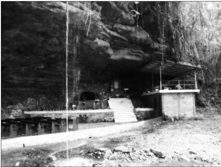
Gruta Nossa Senhora de Fátima. Caverna natural que em 1965 recebeu a imagem da Santa, transformando-a em espaço de fé e religiosidade. Imagem retirada do site da Prefeitura Municipal de Dona Emma – fevereiro de 2011.