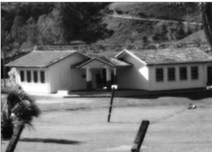
Escola de Ensino Fundamental Professor Paul Richard Eltermann. Substitui a antiga E.E.R.R. Irmã Luiza Venturi, fundada em 1923 por imigrantes teuto-russos.