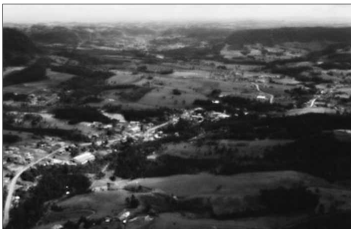
Vista aérea do município de Dona Emma – fevereiro de 2011.

A sede do município ocupa um vale localizado a 390 metros acima do nível do mar e o seu ponto mais alto, na comunidade de Caminho do Morro, na região noroeste da cidade, tem altitude de 715 metros.