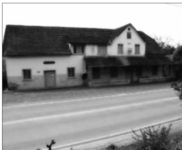
Residência da Família Schwarz, construída em 1923.

A seguir veremos uma sequência de fotos que contam um pouco da saga de formação da cidade, de como ela foi se tornando um município tão importante para a região do Alto Vale do Itajaí.