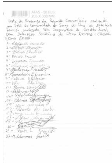
Ata da constituição da cooperativa.