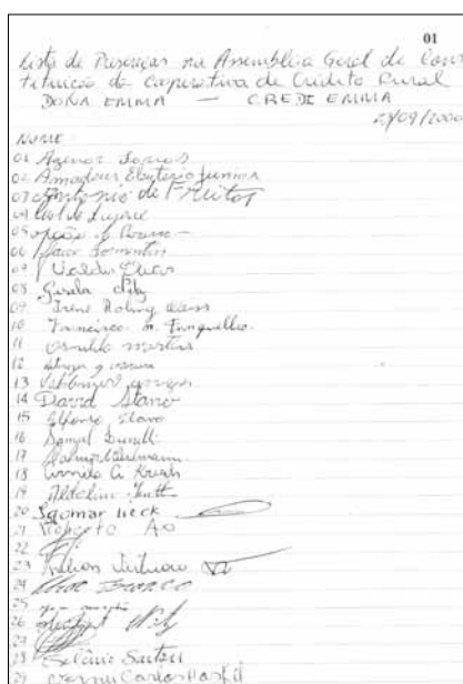
Lista de presenças na Assembléia Geral de Constituição de Cooperativaz de Crédito Rural Dona Emma

A partir do desejo de constituir uma cooperativa voltada para os agricultores familiares, atrelado ao que foi observado na visita às cooperativas do Sistema Cresol no Paraná, iniciou-se um amplo debate envolvendo lideranças, agricultores e entidades na busca de sua viabilização. O grupo que coordenou esse processo também articulou um roteiro de reuniões nas comunidades para apresentar aos agricultores familiares tal proposta. Graças a isso que o projeto foi se concretizando.