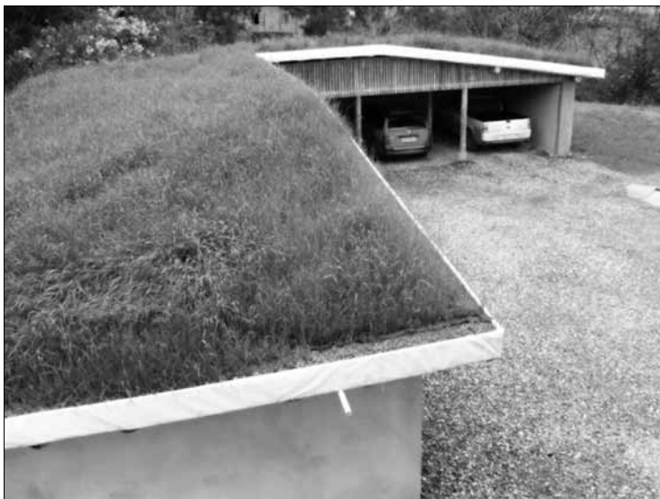
Garagem da Cresol Dona Emma construída durante o ano de 2008.

Vale a ressalva sobre o fato que, devido ao compromisso do Sistema com o tema da bioconstrução, a Cresol Dona Emma construiu sua garagem seguindo o modelo de construção alternativa, visando assim estimular o surgimento de novas iniciativas com essa mesma metodologia na região.