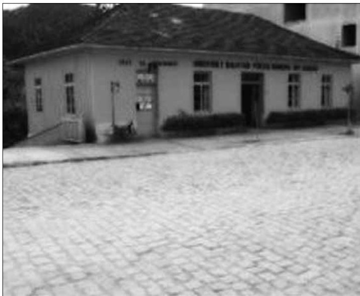
Biblioteca Municipal Rui Barbosa. Construída em meados da década de 1930, foi a sede da primeira intendência.