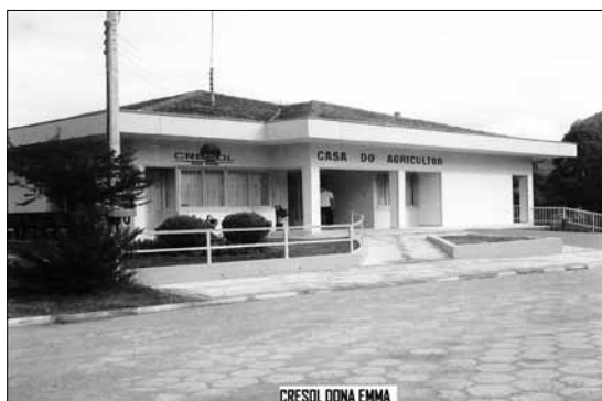
Fotos da inauguração.

A construção contou com a participação de muitos associados que, solidariamente, doaram parte do seu tempo a essa empreitada, vivenciando-se, na prática, a experiência do cooperativismo e do associativismo. Após vários meses de trabalho, no dia 16 de maio de 2004, ocorreu o ato de inauguração da sede própria, sendo motivo de festa e alegria por parte dos associados e da comunidade em geral, reforçando assim a confiança e a credibilidade da cooperativa em relação ao seu quadro social e também fortalecendo a marca Cresol em toda a região. Ressaltamos que os recursos para a construção da sede foram oriundos do Governo Federal, contando com participação do poder público municipal e da Cresol.