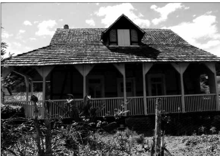
Casa da Família Ax, construída em 1924.