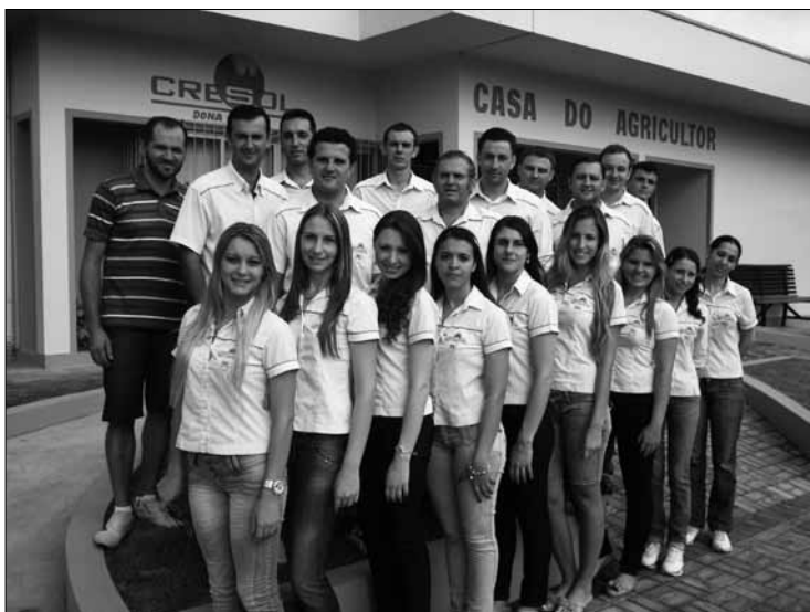
Equipe funcional e diretores da Cresol Dona Emma – fevereiro de 2011.

Destaca-se que o primeiro ano apresentou muitas dificuldades, pois foi necessário fazer com que os agricultores apostassem na cooperativa e fizessem sua movimentação de recursos, garantindo negócios e, conseqüentemente, a viabilidade financeira da cooperativa. O esforço por parte das lideranças, parceiros, diretores e colaboradores se deu com o intuito de garantir a inserção e a consolidação da cooperativa no município e região, e para tanto várias foram as ações desenvolvidas.