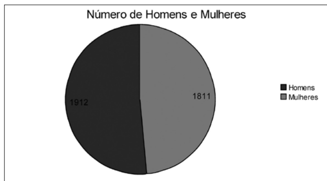
Gráfico 02: Número de Homens e Mulheres em Dona Emma

Analisamos também a divisão do total da população de 3.723 entre homens e mulheres levantados pelo censo realizado em 2010, podemos analisar no gráfico a seguir que existe no município uma pequena quantidade maior de homens.