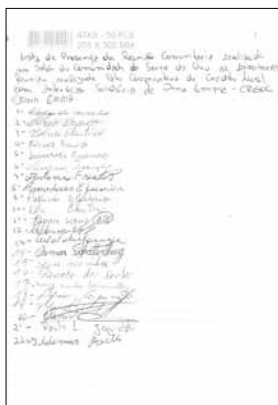
Lista de presença de reuniões nas comunidades.

Os agentes comunitários de desenvolvimento e crédito são estratégicos no trabalho de organização e mobilização das reuniões e pré-assembleias, pois são eles que convidam os associados e os potenciais sócios para participarem desses encontros.