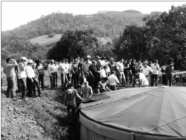
Intercâmbio sobre Cisternas realizado por associados da Cresol Dona Emma e Base Regional, Formosa do Sul, 2010.

Ainda no tema da formação, seguindo as orientações da Cresol Central SC/RS, a Cresol Donna Emma busca de forma permanente capacitar seus associados com atividades relacionadas à habitação, ao Pronaf, à produção orgânica, organização e planejamento da propriedade, entre outras temáticas relacionadas à agricultura familiar. Seguindo essa mesma linha, vale destacar que a cooperativa busca dar suporte e acompanhamento técnico aos seus associados, havendo um técnico agrícola capacitado para orientar os agricultores. Desde seu início a cooperativa possui uma preocupação relacionada às ações de ATER (Assistência Técnica e Extensão Rural). São realizados dias de campo, intercâmbios, oficinas temáticas buscando levar informações e novas tecnologias aos agricultores da região. Essa forma de trabalho tem sido um grande diferencial da Cresol Dona Emma, pois além de repassar o crédito, busca-se acompanhar os agricultores com orientação técnica especializada.