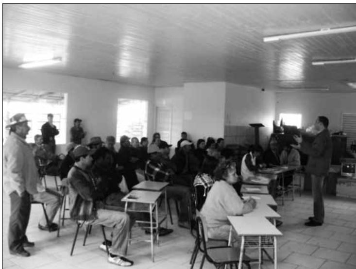
Reuniões da Cresol Dona Emma nas comunidades.

Diante dessa necessidade, o conselho de administração constitui roteiros de reuniões para debater com os seus associados sobre as decisões futuras. Esse procedimento, além de criar comprometimento entre os associados e a cooperativa, diminui as possibilidades de erro na tomada de decisões por parte do conselho administrativo, o qual é eleito pelos associados e que deve assim, necessariamente, ouvir a opinião do quadro social.