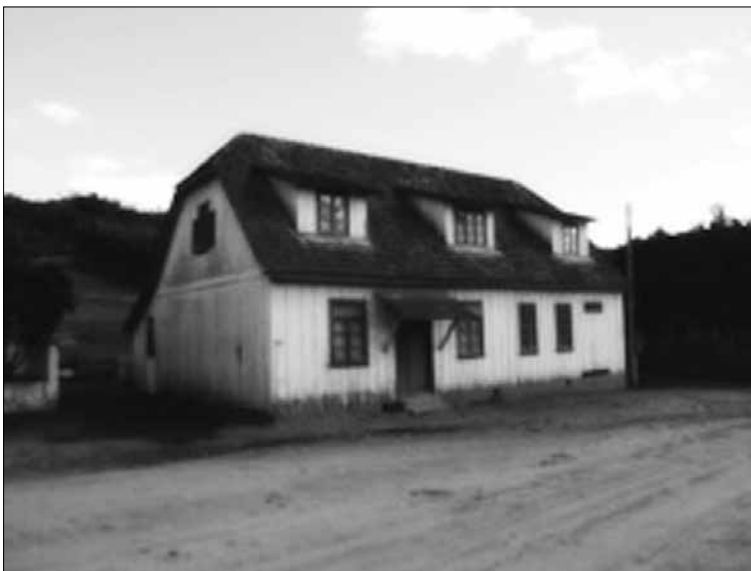
Comercial Carlos Fleming. Construída no início da década de 1950 por Henz Helmut. Imagem retirada do site da Prefeitura Municipal de Dona Emma – fevereiro de 2011.