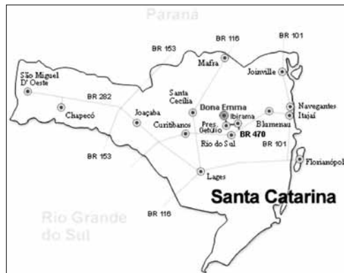
Localização de Dona Emma.

O Município de Dona Emma está situado no Vale do Itajaí do Norte, microrregião do Alto Vale do Itajaí. Possui uma extensão territorial de 181,018km 2 . Pertence à Associação dos Municípios do Alto Vale do Itajaí (AMAVI). A distância entre a cidade de Dona Emma e a capital Florianópolis é de 237 km, com acesso pela rodovia BR 282, e de 257 km, pela BR 101. Limita-se ao Norte com Witmarsum e José Boiteux; ao Sul com Presidente Getúlio e Rio do Oeste; a Leste com Presidente Getúlio; e a Oeste, com Taió e Witmarsum. Juridicamente, pertence à recém formada Comarca de Presidente Getúlio.