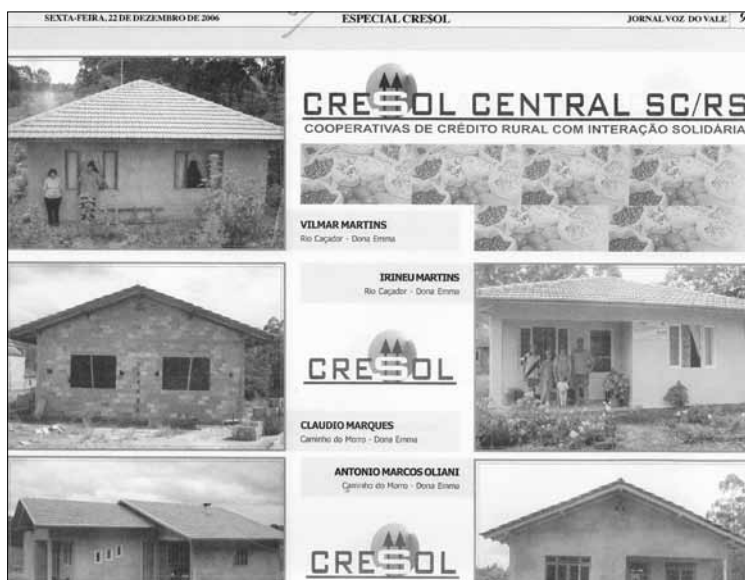
Foto de beneficiário da habitação.